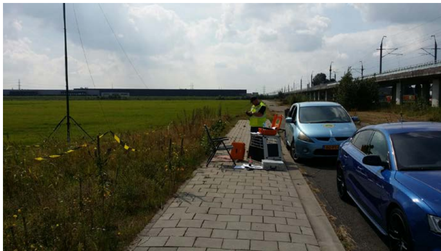
De opbouw van post 2 Net Control