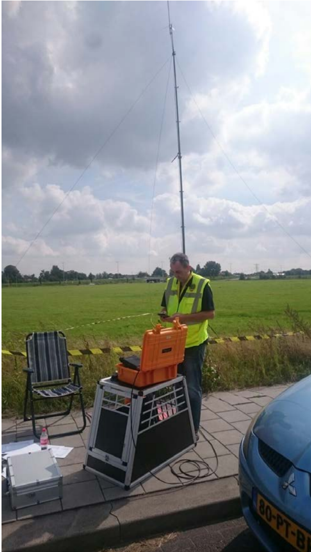
Post 2: Net control