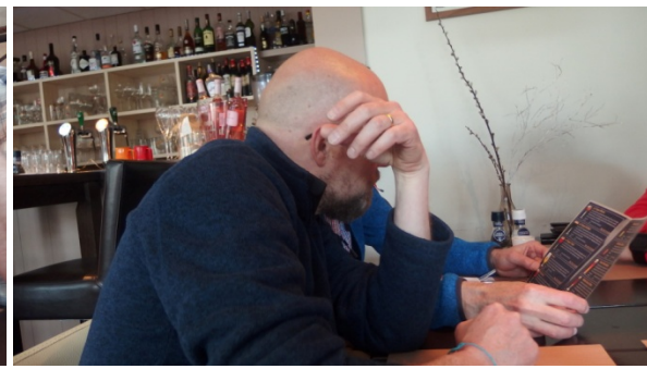
Schaamt PE2OND zich nou voor zijn keuze ?