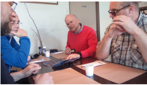
We kijken verlekkerd op de menukaart