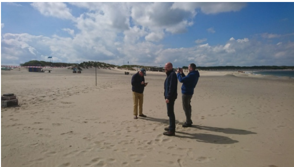
De NVIS avonturen op het Noorderzeestrand. Daarna moesten we het zand uit de FT-897 schudden ☺

besloten we uit te wijken naar het Noorderzeestrand. Alle spullen ingeladen, zoals mastdelen, de eigenlijke antenne natuurlijk, afspanlint, ductape, tie-wraps en noem maar op. Er stond een flinke wind. En Martijn was de poweraansluiting voor de FT-897 vergeten mee te nemen, dus hij ging weer even terug, waardoor PD1WGL de kans te baat nam om zijn FT-817 uit te proberen. Er was genoeg te horen, maar QSO's ho maar. De NVIS was nu afgespannen op ca. 1,50 meter hoogte over de gehele lengte, maar we hadden wellicht onvoldoende tegencapaciteit. Op de wikipedia site over NVIS lees je bovendien dat er nog andere afspan varianten zijn, dus die nemen we mee voor de volgend keer. Wel hoorden we ook een DARES oefening op de 80 meter band, maar ook die stations konden elkaar onvoldoende horen, dus weken zij uit naar de 40 meter. We waren met de bolide van PD1WGL nog even een eindje weggereden om met zijn on-board FT-897 en ATAS antenne te testen of wij te horen zouden zijn bij het strandteam en dat ging ook prima over en weer. Maar dat zal nog wel steeds de grondgolf zijn geweest, dunkt me.