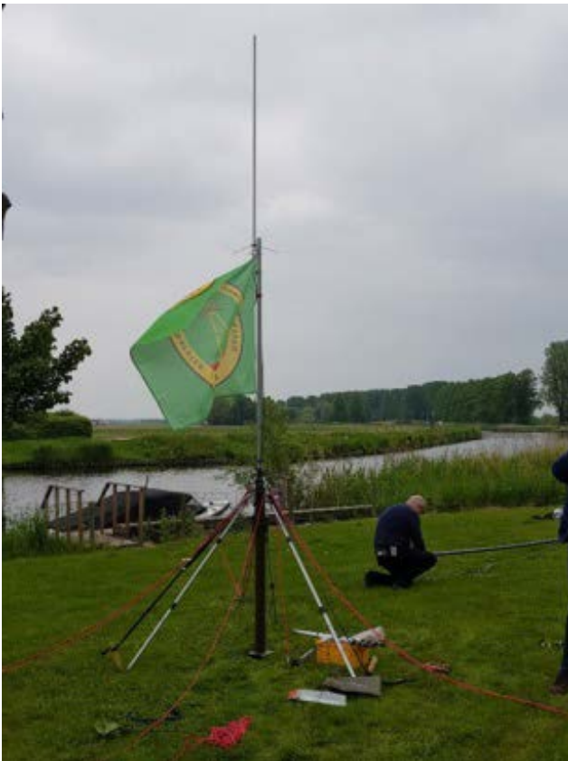
PU8 ingeschoven positie

Door het groter en mooier worden het aantal masten en antennes meer en coax kabels langer. Maar opbouwen kost gemiddeld 2 uur en afbreken gaat nog altijd in een uur.